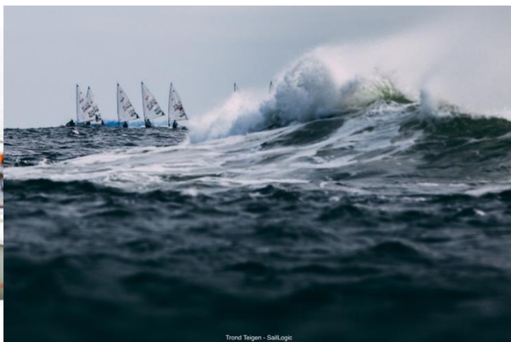
Stemmingsbilde som sier noe om været NSF sin høstsamling.