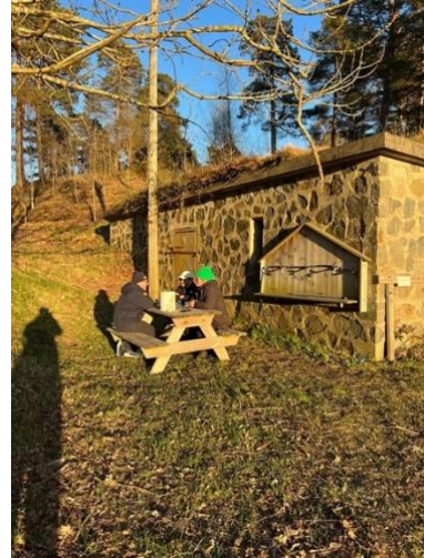
Foresatte har det også kjekt på tur.